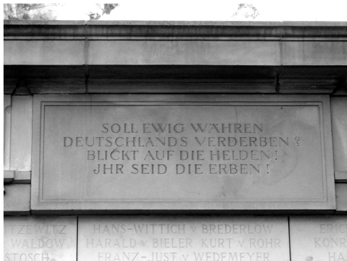
Gedenktafel für die im zweiten Weltkrieg gefallenen Soldaten des Corps Saxo-Borussia in der Friedrich-Ebert Anlage

Problematisch ist weiter, dass zahlreiche Burschenschaften ihre Rolle im Nationalsozialismus nicht aufarbeiten und zum Beispiel die aktive Mitwirkung an den Bücherverbrennungen leugnen. So beschlossen im Juli 1935 auf Drängen der Deutschen Burschenschaft alle Verbände der Gemeinschaft Studentischer Verbände mit Ausnahme des Kösener, des Wingolf und des Wernigeroder Verbandes alle „Nichtarier“ auszuschließen. (Heidelberger Geschichtsverein e.V. www.s197410804.online.de/Zeiten/1933.htm )